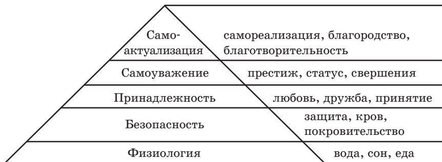
Рис. 1. Пирамида потребностей А. Маслоу

не чувствуем себя одинокими, секс). Бытийная любовь , наоборот, основана на осознании человеческой ценности другого, без какого-либо желания изменить или использовать его. Она не собственническая, не назойливая, бескорыстная, здесь наградой является сам акт любви, восприятия сущности и красоты объекта любви.