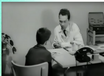
"Дети без любви"

Будут полезны приемным родителям, родителям-воспитателям детских домов семейного типа также специалистам, работающим в сфере семейного устройства.